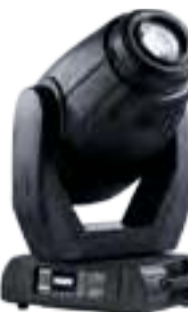
ROBIN MMX Blade